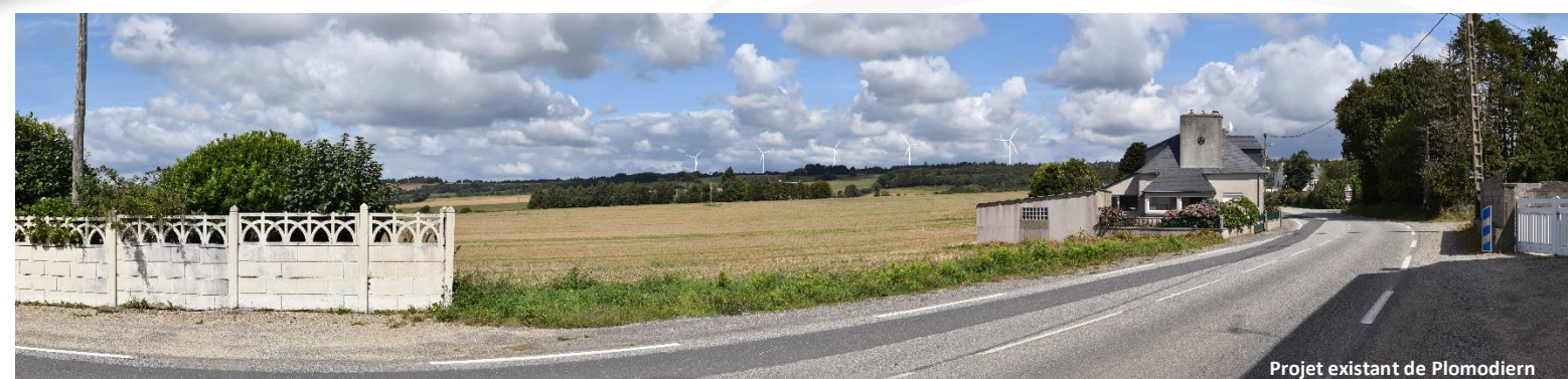
Projet existant de Plomodiern

Bureau d'études en environnement énergies renouvelables et aménagement durable