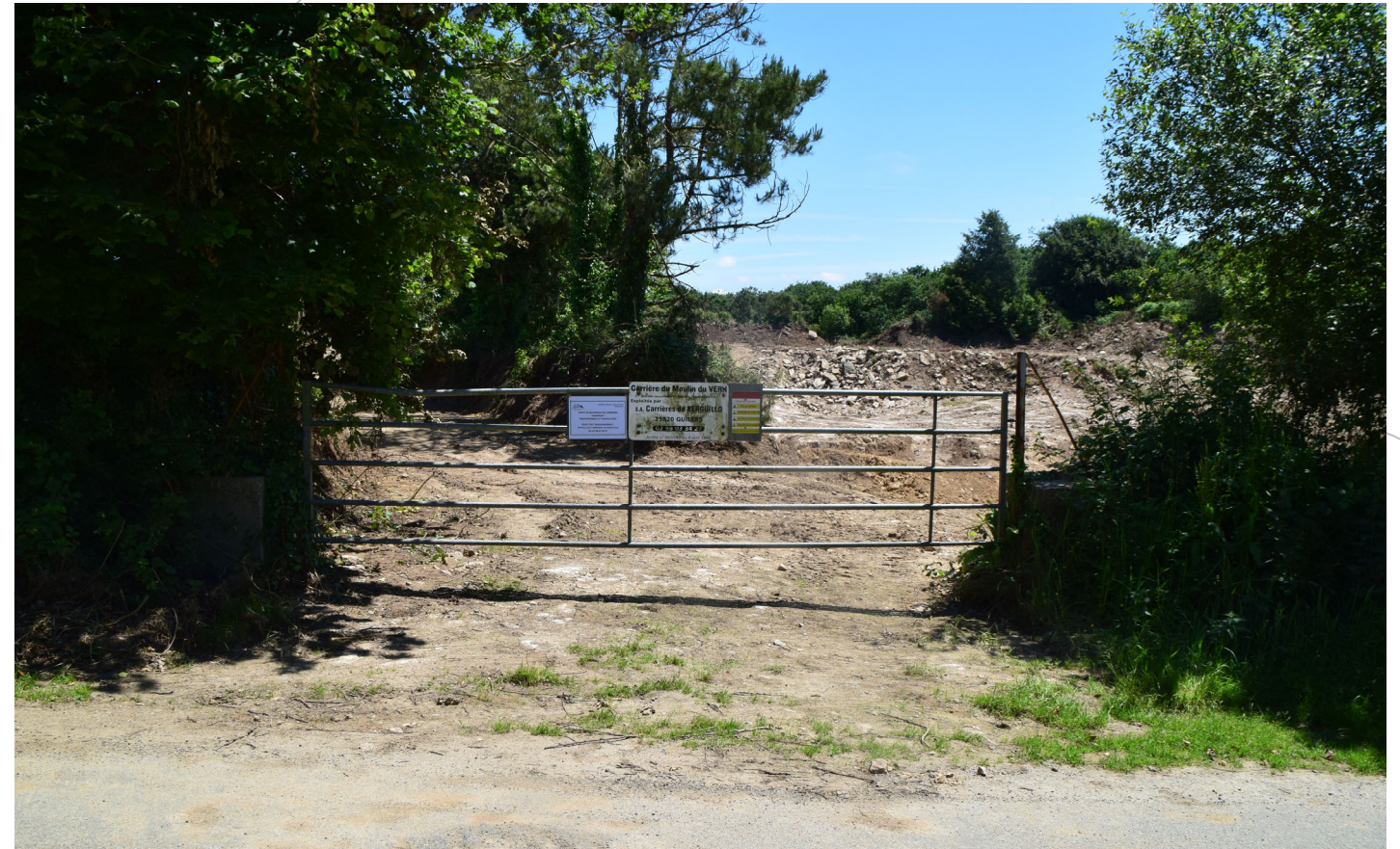
Carrière du Moulin du Vern Commune de Kernilis (29)

Renouvellement d'une carrière de roches massives